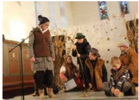
Hirtenszene Krippenspiel 2017